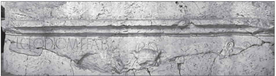
Fig. 2. Sviluppo orizzontale dell'ara