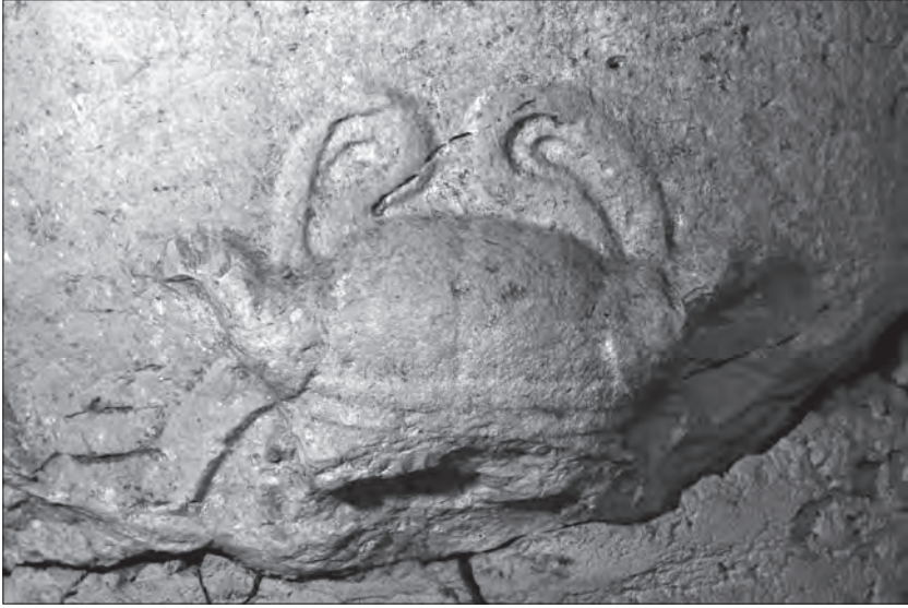
Fig. 3. Dettaglio di uno dei bucrani

esemplare. Da segnalare che il bucranio è poco diffuso nelle raffigurazioni presenti sulle are funerarie del nord Italia e che in questo caso la sua tipologia, difficile da comprendere appieno a causa della frammentarietà, sembra essere tuttavia diversa dal tipo scarnificato presente su un'ara da Concordia 18 , e nemmeno assimilabile a quelli presenti su due are bergamasche 19 , su quella di Erbusco 20 e su un frammento, in verità molto deteriorato, dal Cremasco 21 . L'iscrizione è disposta su due righe, con lettere regolari e ben eseguite a solco triangolare, alte rispettivamente cm 8 e cm 6 (restanti); le M presentano aste allargate e le O sono perfettamente circolari. Le parole sono separate da profondi segni d'interpunzione triangolari. Al di sotto della I di Clodio , è visibile un breve tratto orizzontale, che potrebbe essere interpretato come parte di una soprallineatura, ma che in realtà è una fessurazione della pietra (fig. 4).