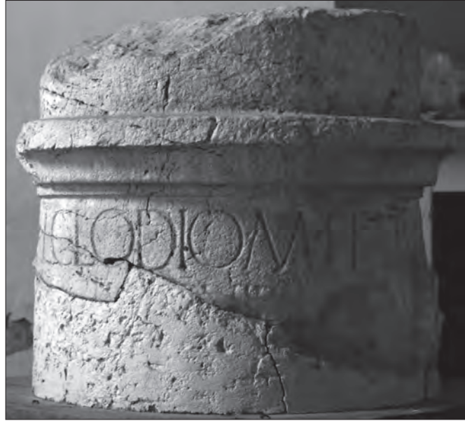
Fig. 1. Ara cilindrica da Gambara

È un altare cilindrico, mutilo della parte inferiore (altezza m 0,58; diametro massimo m 0,75), in calcare bianco di Vicenza 4 , con un alto coronamento unito al fusto da una modanatura a listello molto aggettante e gola. La superficie è interessata da numerose scheggiature e fratture ora ricomposte (figs.1-2). Sul coronamento vi sono due fori quadrangolari al centro e altrettanti sui lati, probabilmente per l'inserimento di elementi architettonici metallici.