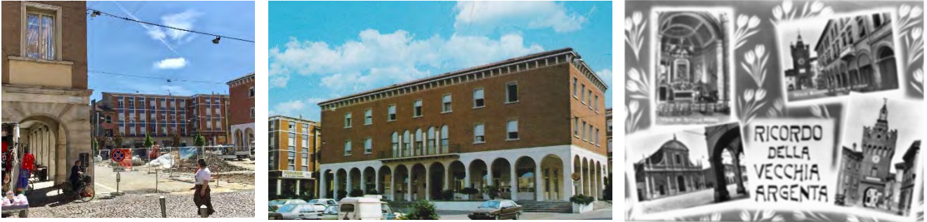
Fig. 10a – L’assetto formale e funzionale di Piazza Garibaldi, ultimato nei primi anni Settanta del secolo XX, sostituiva e alterava gli storici focus prospettici – Fonte: foto di Andreina Milan. Fig. 10b – Il nuovo Municipio di Argenta – Fonte: Foto di Andreina Milan. Fig. 10c – Cartolina ricordo della vecchia Argenta con vedute della piazza, della Torre del Primaro, della Collegiata di San Nicolò