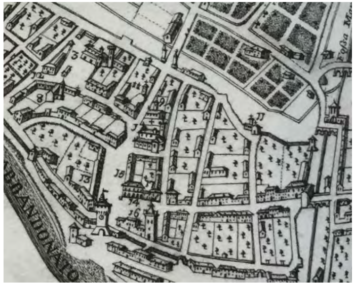
Fig. 6a – La piazza di Argenta nel 1658, con rappresentazione della cinta muraria e del complesso di San Nicolò in Borgo – Fonte: F. L. Bertoldi, Memorie storiche d'Argenta, 1787. BCA – Biblioteca Comunale di Argenta). Fig. 6b – Mappa a volo d'uccello. Dettaglio degli ampi broli intra-moenia – Fonte: G. Padovani, dett. mappa Argenta, 1774, BCA