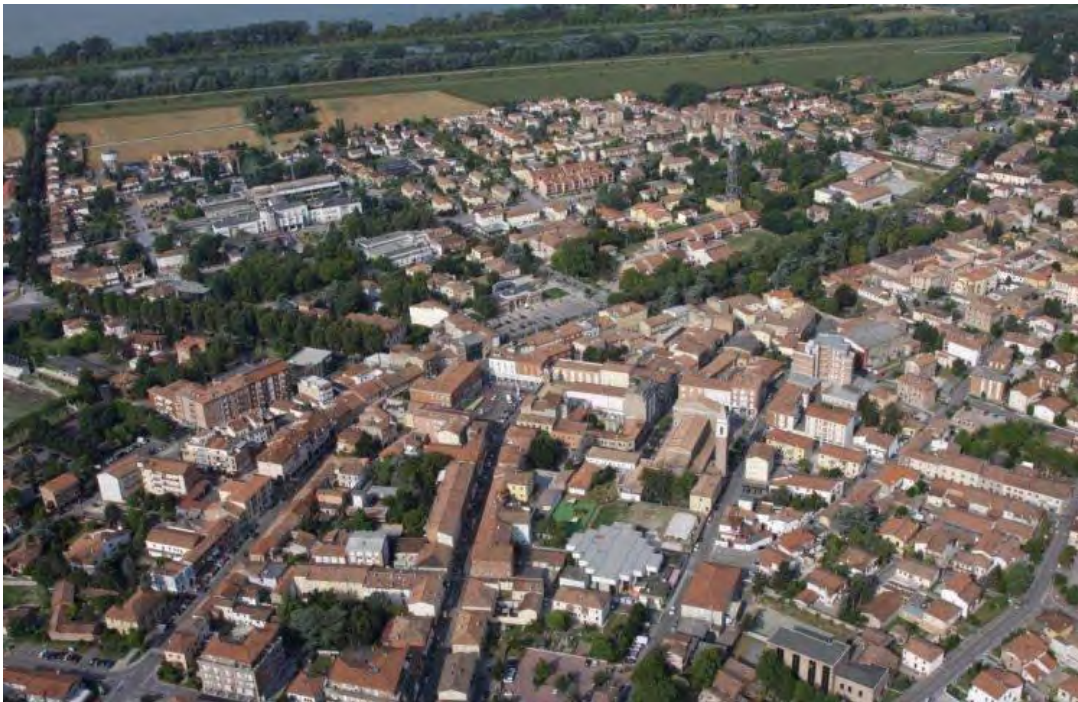
Fig. 1 – Veduta aerea della porzione centrale di Argenta e delle piazze. È visibile, a sinistra, il sedime che ricalca la scomparsa cinta muraria, poco discosta dal percorso antico del Po di Primaro. Sullo sfondo, l'inalveazione del Reno

Dal punto di vista amministrativo, dal 2013, il territorio comunale è incluso nell' Unione dei comuni Valli e Delizie , formata dai comuni di Argenta, Ostellato, con capoluogo Portomaggiore.