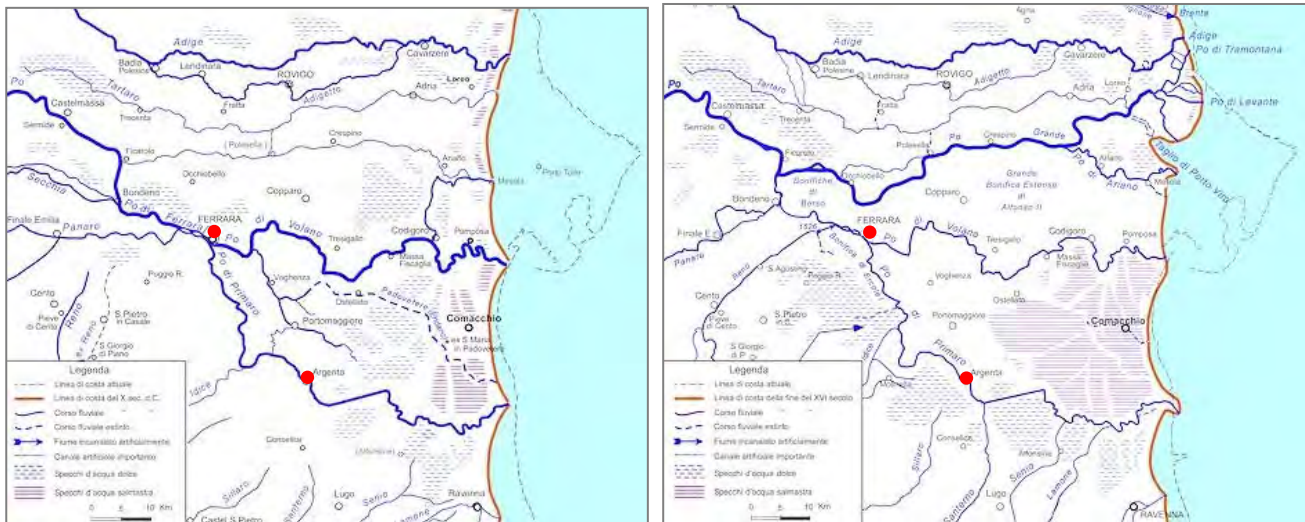
Fig. 2a – Il territorio basso-padano in epoca alto-medievale (ca. 476-1000 d.C.). Il peggioramento climatico culminato intorno al secolo VI (Diluvio di Paolo Diacono), aumenta la portata idrica al Volano e Primaro, portandoli ad essere i rami principali del Po. Alla loro biforcazione nasce Ferrara –. Fig. 2b – Il territorio basso padano in epoca basso-medievale (c.a. 1000-1492). Tra il XII e il XIV secolo i deflussi del Po si trasferiscono in un nuovo alveo, decretando la decadenza del Po di Ferrara, del Volano e del Primaro. Il cuneo salino invade i territori del Basso Ferrarese, mentre gli Estensi attuano intorno alla città le prime grandi bonifiche. Situazione del territorio al 1350