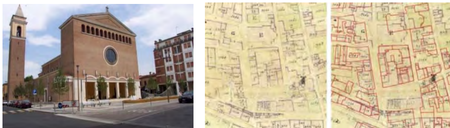
Fig. 9a – La ricostruita Collegiata di San Nicolò. Fig. 9b/c – Mappa del Catasto Italiano con dettaglio della piazza e della collegiata di San Nicolò. La sovrapposizione dell'impianto moderno post-bellico dà conto delle mutazioni impresse al disegno urbano

La città, seppur quasi interamente ricostruita in soli vent'anni, ha perduto irrimediabilmente il carattere e la facies originaria, specie nel cuore dell'insediamento. La Collegiata di San Nicolò – detta “in Borgo” – presente dal 1122 nel nucleo extra-moenia di Argenta, pur restaurata e rimaneggiata, aveva conservato nei secoli il proprio sedime: l'intervento ricostruttivo condotto per conto del Ministero dei Lavori Pubblici negli anni 1946-1954, su progetto di Giuseppe Vaccaro (Fig. 9a), fu del tutto stravolgente, nelle forme e nella collocazione, ponendo il corpo di fabbrica in forte arretramento rispetto al filo degli isolati storici (Fig. 9b).