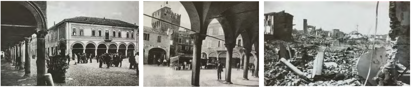
Fig. 8a, 8b, 8c – Piazza Garibaldi già Piazza del Mercato. Il Palazzo e Loggia Comunale, prima e dopo le distruzioni belliche – Fonte: Collezione Biblioteca Civica di Argenta

l'insediamento fu gravemente lesionato, con un bilancio di centosettanta edifici crollati, duecento case inagibili, gravissimi danni alla cinta urbana e il dimezzamento delle ventiquattro torri. Né furono risparmiate le chiese, tra cui il Duomo, gli oratori e le cappelle minori.