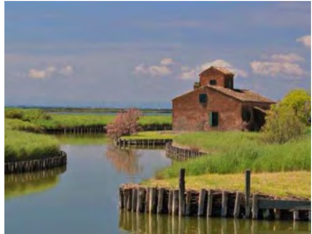
Fig. 3a – Progetto di Gian Battista Aleotti per la Bonifica dello Stato di Ferrara – Fonte: G.B. Aleotti, Difesa di Gio. Battista Aleotti d'Argenta, Architetto, per riparare alla sommersione del Polesine di S. Giorgio, & alla rouina dello Stato di Ferrara (...), Vittorio Baldini stampatore camerale, 1601 – Biblioteca Classense, Ravenna. Fig. 3b – Le Valli di Campotto (Argenta), 2018

La morte del Duca Alfonso II d'Este, nel 1568, e la successiva Devoluzione dei Domini allo Stato Pontificio (Guerzoni, 1999) decretavano per le regioni padano-romagnole un lungo periodo di stagnazione economica e sociale. Ancora una volta, i mutamenti climatici avevano determinato il peggioramento delle condizioni ambientali dell'agro basso-padano, con sempre più frequenti straripamenti dei fiumi e impaludamenti delle campagne; alla conseguente crisi agraria si aggiunsero gli effetti della negligente conduzione amministrativa del Papato che aveva ridotto al minimo le opere di bonifica.