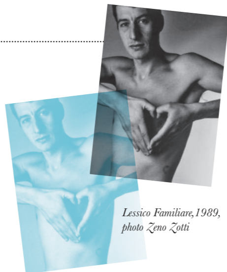
Lessico Familiare, 1989, photo Zeno Zotti