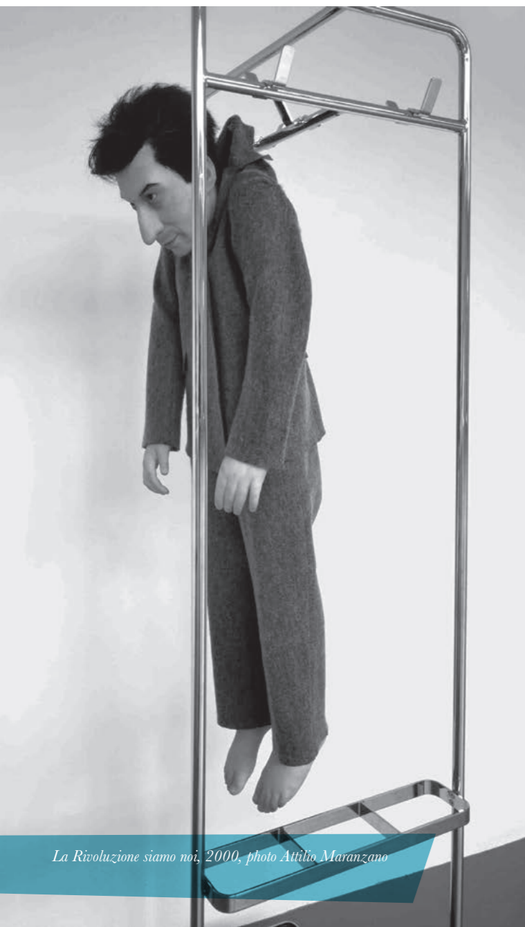
La Rivoluzione siamo noi, 2000

Non ci si poteva sottrarre dal chiudere questa miniserie di articoli intitolati "Nemo propheta in Padova" con il confronto con il più interessante artista padovano contemporaneo, da molti considerato il più influente artista in Italia, certamente il più quotato al mondo. Maurizio Cattelan, ben lo sanno tutti coloro che gravitano nel mondo dell'arte, è artista provocatorio, dissacrante ed ironico. Ama ribaltare il punto di vista, far scendere dal piedistallo grandi figure del contemporaneo, così come destrutturare miti e valori riconosciuti dalla massa. Per dirlo con le sue parole: "I lavori migliori sono quelli che vedi e sai che non sarai mai più come prima. La buona arte è l'arte che non ha paura di essere perfida. Quello che fa un'opera d'arte è estremamente semplice: tratta il famigliaire come se non lo fosse. Questo permette all'artista di disegnare l'assurdità del mondo che ci circonda: esponiamo quello che era nascosto e questo porta stupore, e la sorpresa è solitamente mescolata all'assurdità. Come risultato abbiamo l'umorismo!".