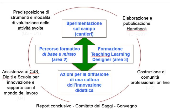
Fig. 2 - Articolazione della seconda annualità di progetto PRODIG

Le attività sperimentali prevedranno alcuni momenti di socializzazione in Ateneo e diffusione delle proposte effettuate e dei risultati (anche provvisori) ottenuti mediante workshops informativi e attività di condivisione.