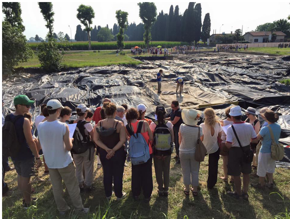
Fig. 5. Il mosaico delle Bestie ferite, parzialmente aperto in occasione dell'Open Day 2015.

particolare, che il lavoro dello specialista si esaurisca nel pensare a “qualcosa” del mondo moderno che spieghi in qualche modo l'evidenza antica, o, in una prospettiva più ampia, che il fitto tessuto di “rovine” messe in luce nel corso dei secoli spieghi già completamente l'intera città romana, rendendo così superfluo ogni studio attuale e futuro, destinato ad essere un costoso orpello per le comunità locali e a non necessitare di lavoro archeologico o, più in generale, di ricerca.