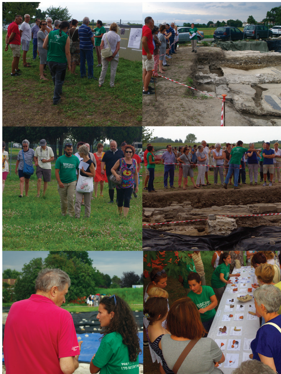
Fig. 3. La sequenza di attività di un'Open Day: dall'accoglienza, alle spiegazioni in più punti del sito, collettive o personali, all'esposizione dei materiali.