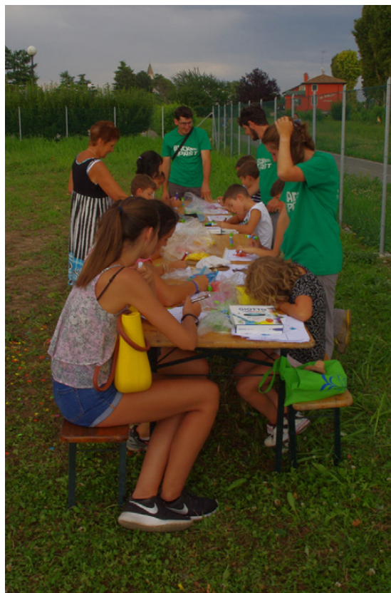
Fig. 4. Bambini e ragazzi alle prese con laboratori sul mosaico romano.

A fianco dei percorsi per visitatori adulti vengono inoltre organizzate attività per le scolaresche o dedicate ai bambini che presenziano alle giornate di scavo aperto (Fig. 4). Gli aspetti logistici relativi alla perma-