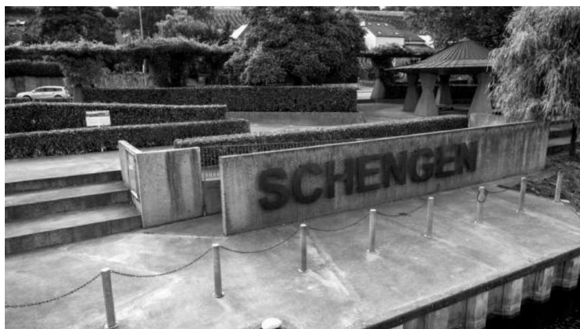
Muro con scritta Schengen in Lussemburgo

❗ La vostra domanda suggerisce la possibilità che ciò che chiamiamo discorsi tecnici sull'amministrazione e la politica tendano a crescere e declinare. Riguardo il tecnicismo, elaboro la vostra considerazione e la intendo come un modo per riferirsi a un tipo di fantasia politica in cui