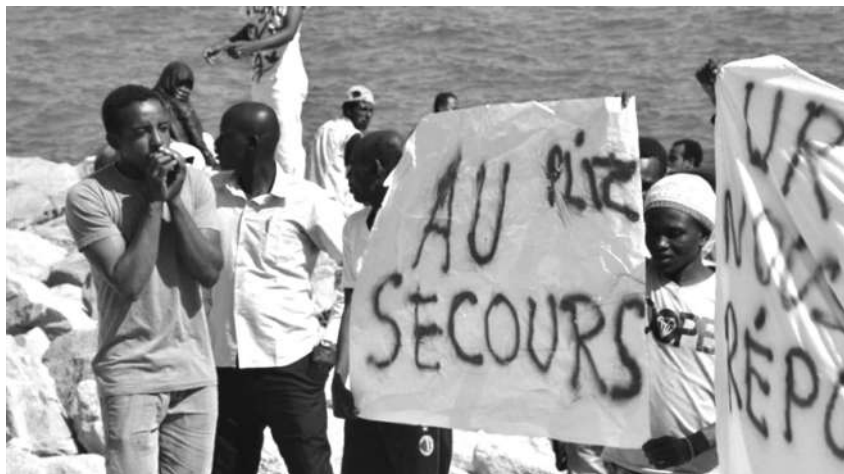
Alcuni migranti protestano sugli scogli di Ventimiglia contro l'indifferenza delle istituzioni europee e delle autorità nazionali

Attualmente lavora su vari progetti tra i quali vale la pena di segnalare una ricerca sulla "deportazione forzata via aereo" attuata da alcuni stati europei, e altri lavori inerenti al governo delle migrazioni, le pratiche di resistenza e i confini.