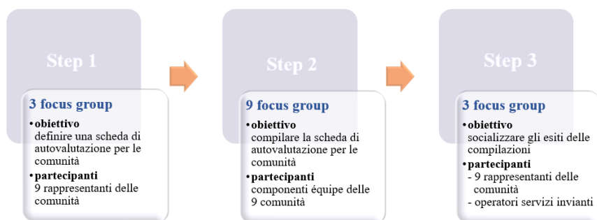
Figura 1: Design della ricerca azione

Rimanendo in questo perimetro metodologico, va notato come si sia dovuto rimodulare il disegno della ricerca a seguito della sopravvenuta emergenza sanitaria del marzo del 2020: inizialmente gli step previsti erano due: il primo era costituito da interviste semi-strutturate agli educatori ed osservazioni etnografiche all’interno delle strutture, mentre il secondo coinvolgeva tutti i partecipanti in focus group. Nel quadro delle misure straordinarie per il contenimento della diffusione del COVID-19, l’attivazione della partecipazione e l’individuazione di un efficace innesco del processo di ricerca si sono, di fatto, aggiunti ai problemi di indagine: conseguentemente, si è valutato di suddividere lo studio in tre momenti distinti (fig.1), mentre la scelta degli strumenti di ricerca si è ristretta al focus group, in quanto tipologia di rilevazione dati che facilita la creazione di una situazione comunicativa in cui i componenti risultano facilitati ed invitati a al dialogo e al confronto (Bloor, 2002; Furedi, 2003).